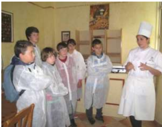
Les recommandations d'une étudiante en 1ère année

Ils ont rencontré des étudiants qui leur ont communiqué leurs conseils et leur motivation pour travailler dans la restauration.