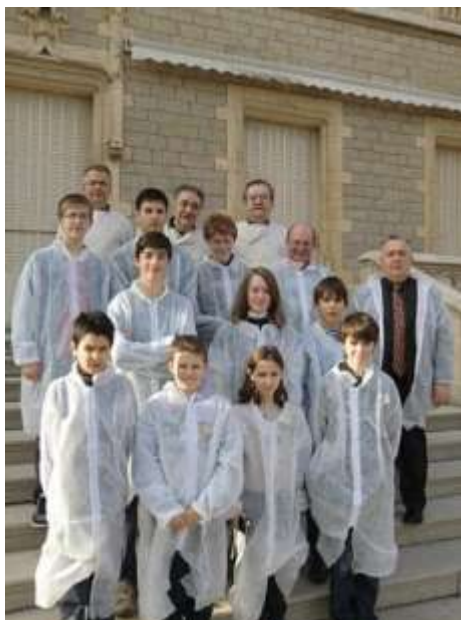
Visite du 23 février 2011