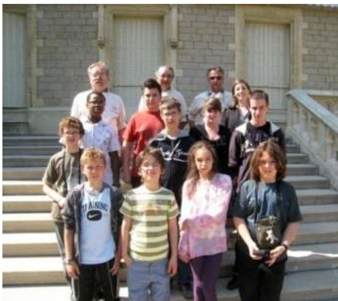
Visite du 20 avril 2011