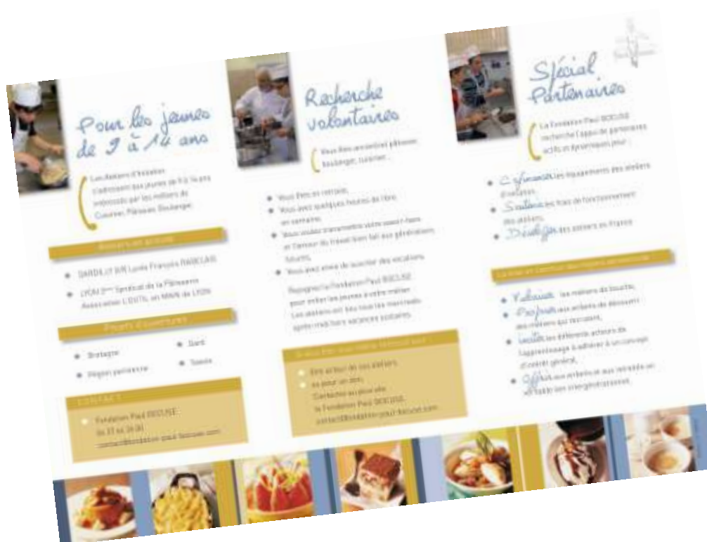
La plaquette de présentation des Ateliers d'Initiation