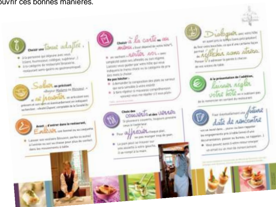
Plaquette de présentation des Ateliers Savoir-être à table

La petite fille de la célèbre Mère BRAZIER transmet tout son savoir et sa passion aux jeunes avides de découvrir ces bonnes manières.