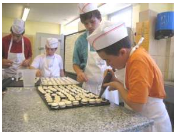
Ganache au chocolat sur macarons

A la fin de l'année, la moitié du groupe (soit quatre enfants) souhaite se former aux métiers de la cuisine . Après les démarches pour leur trouver des lieux de stage, la Fondation Paul BOCUSE a déjà entrepris les recherches d'entreprise pour les accueillir en apprentissage.