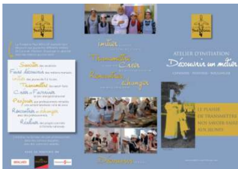
Plaquette de présentation des Ateliers d'initiation «Découvrir un Métier»

A la rentrée 2011, deux nouveaux ateliers ouvriront : l'un à Seynod (74) dans le lycée Professionnel Les Bressis, l'autre à Tain l'Hermitage (26) dans le lycée Hôtelier l'Hermitage.