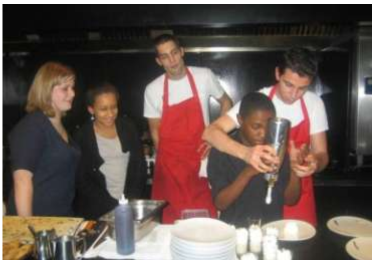
Les enfants au restaurant PINXO

A la veille des fêtes de Noël, les quatre jeunes sont arrivés à Paris pour découvrir des lieux mythiques de la gastronomie française et rencontrer les Chefs. Tous les enfants et leur maman furent hébergés à l' Hôtel RENAISSANCE-PARIS-VENDOME , jouxtant le restaurant ' PINXO ' où le Chef Alain DUTOURNIER les a accueillis autour d'un dîner. Il a eu plaisir à répondre, à toutes leurs questions, leur prodiguant des conseils avisés.