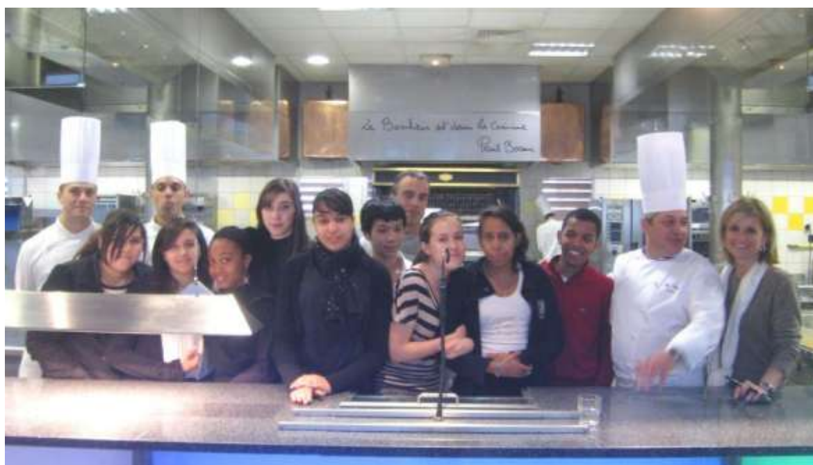
« Un Jour, Un Métier », à la Brasserie de l'OUEST

2 objectifs : · Pour les jeunes → se projeter dans l'avenir · Pour les salariés → s'engager dans la démarche sociétale de leur entreprise