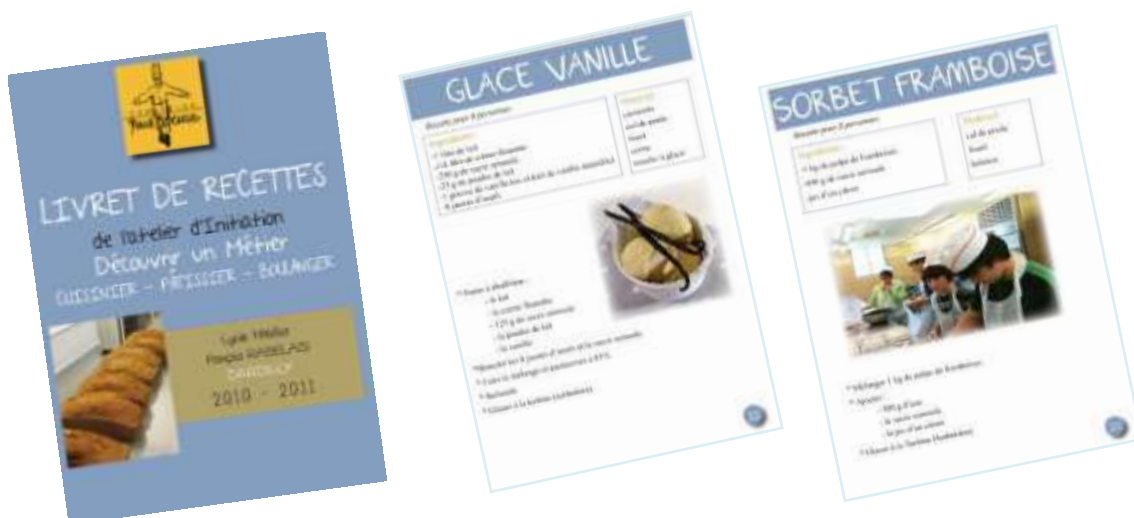
Le livret de recettes présentant les 17 recettes vues au cours de l'année.