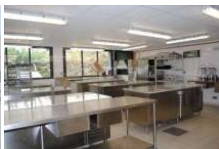
Les cuisines professionnelles