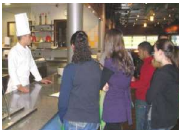
La gestion du pass