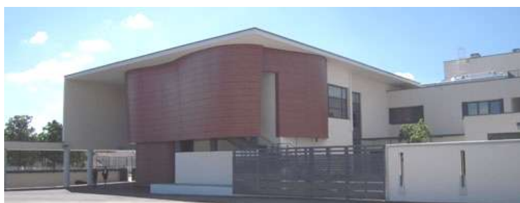
Le Lycée de l'Hermitage

La Fondation Paul BOCUSE recherche un Homme de métier pour animer l'Atelier les mercredis après-midi.