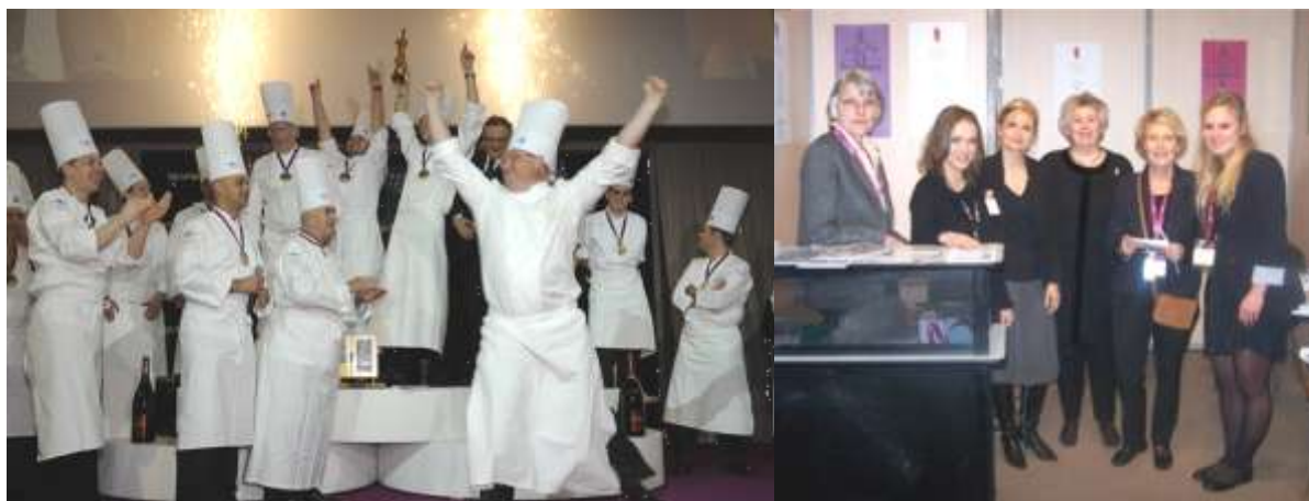
Photo tirée de l'édition 2011 du Sirha

Le SIRHA, salon professionnel international organisé par GL Events, s'est déroulé du 22 au 26 janvier 2011 à Lyon. Réunissant acteurs du secteur de la Restauration et de l'Hôtellerie, cet événement incarne leurs valeurs : la passion, l'authenticité, l'innovation et l'excellence.