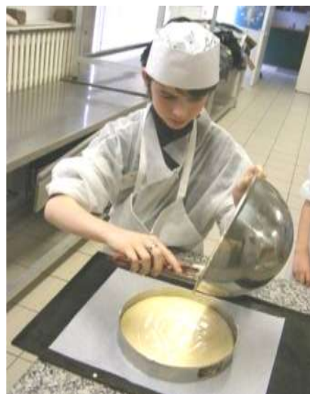
Les mercredis après-midi au Syndicat de la Pâtisserie